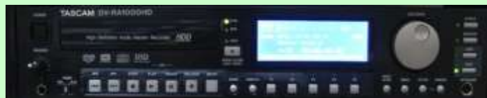
(デジタルマスターレコーダー TASCAM DV-RA1000HD)

16ビット、44.1Khzで録音された通常CDに対し、1ビット、2,822.5khzでサンプリングされるため、元のアナログ情報に非常に近い波形が得られます。