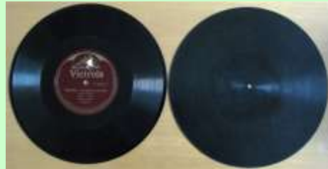
グルーブ(記録)面 裏面