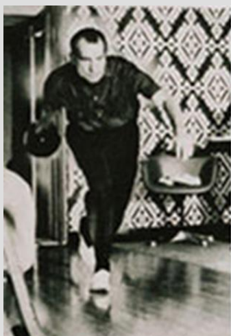
助走ステップも軽やか ニクソン大統領