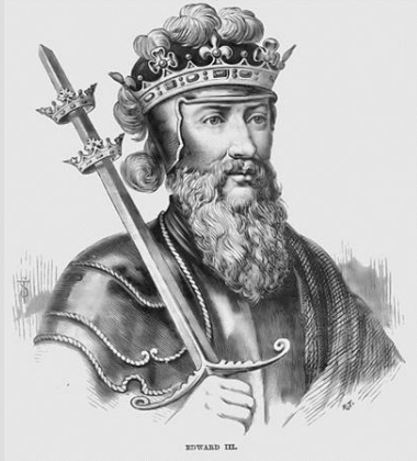
エドワード3世 (イングランド王)