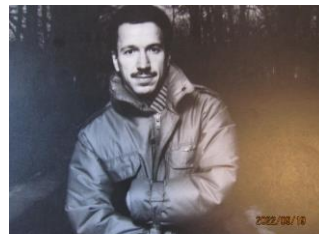
心の瞳のジャケット