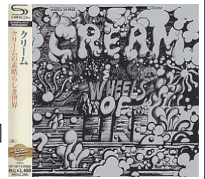
クリーム名作 Wheels of Fire 「クロスロード(1970)」