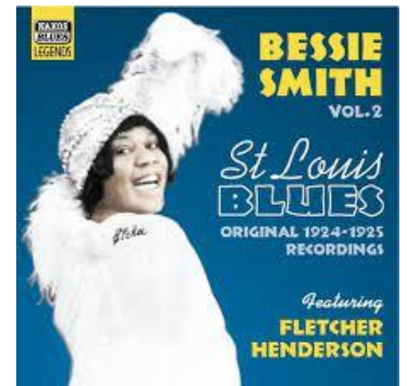
ベッシー・スミス セントルイス・ブルース(1929)