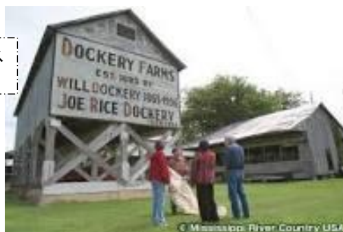
ドッケリー・ファーム(ブルース 誕生の聖地)