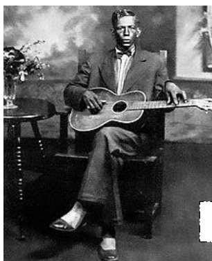
チャーリー・パットン(1929)

【2】 チャーリー・パットン (Charley Patton : 1891-1934) と ドッケリー・ファーム 01:24