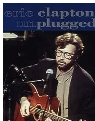
エリック・クラプトン (1992) 名作アンプラグド